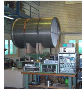
Mischerelement auf dem Rütteltisch