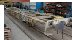
Schwingungstilger für Güterwagen