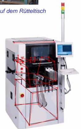
Modalanalyse: Bestückungs- automat für die Mikroelektronik- Industrie