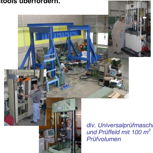
div. Universalprüfmaschinen und Prüffeld mit 100 m 3 Prüfvolumen