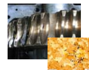
Einfluss der Materialqualität auf die Lebensdauer