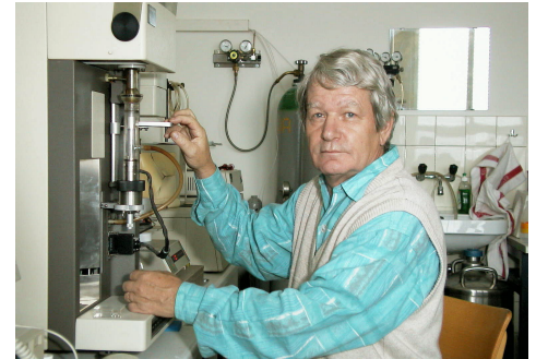
TGA-Analyse: Perkin Elmer

Die Methoden der TA erweisen ihre Leistungsfähigkeit bei der vergleichenden Materialprüfung. Dabei werden charakteristische Temperaturen (Glasübergangstemperatur, Schmelztemperatur, Zersetzungstemperatur), die spezifische Wärmekapazität c_p , der thermische Ausdehnungskoeffizient \alpha , die Masseänderung, die Elastizitätsmoduli etc. betrachtet.