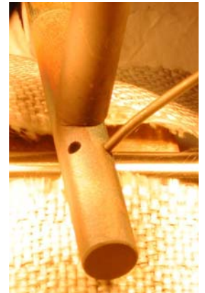
Stift auf Stift Fretting-Test von Ni Superlegierung bei 500°C

Vermeiden Sie Verschleisschäden durch Fretting. Nutzen Sie unsere Dienstleistungen, um Ihren Produkten den entscheidenden Vorteil zu sichern.