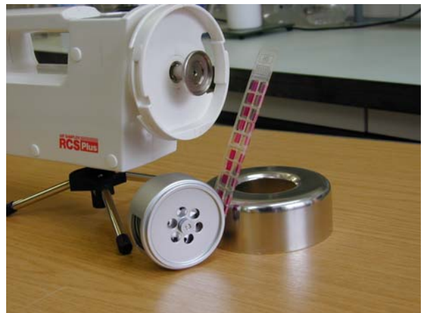
Probenentnahme von Raumluft mit Sampler